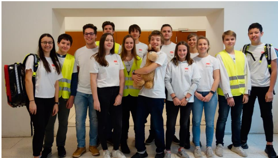
Die Sanis vom Starkenburg- Gymnasium